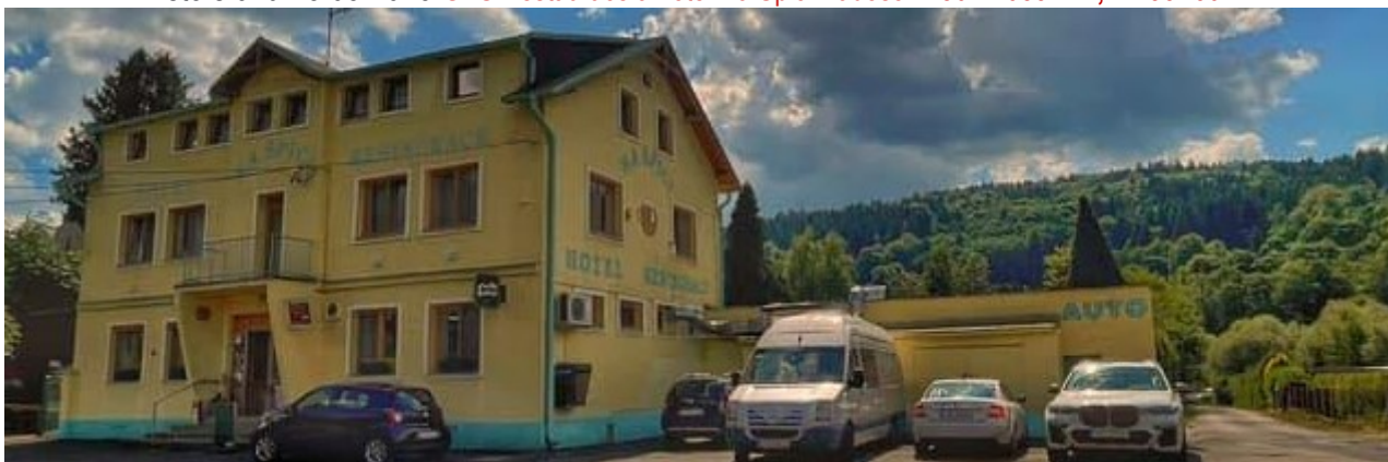
Místo v honitbě GPS v honitbě „BUFET“ u Javorenského rybníka: 50.1804311N, 13.0734756E