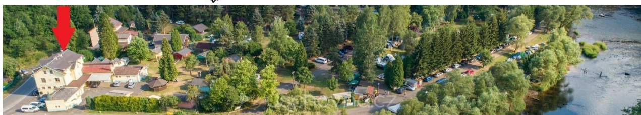
Místo srazu 25.08.2023 GPS Restaurace a hotel Na Špici Radošov: 50.2703914N, 12.9946042E